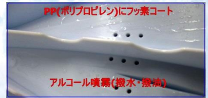
PP(ポリプロピレン)にフッ素コート